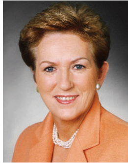
Maria Rauch-Kallat Bundesministerin für Gesundheit und Frauen