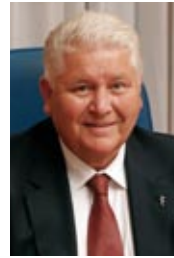
Alois Stöger diplomé Bundesminister für Gesundheit

Diese Broschüre möchte den Ärztinnen und Ärzten einige wichtige Fakten rund um das Thema Generika präsentieren, um einerseits Unsicherheiten abzubauen und andererseits mögliche Wissenslücken aufzufüllen.